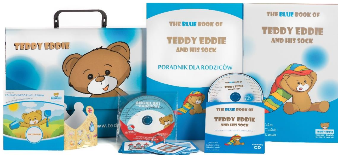
Zestawy występują w kolorach niebieskim, czerwonym lub żółtym.